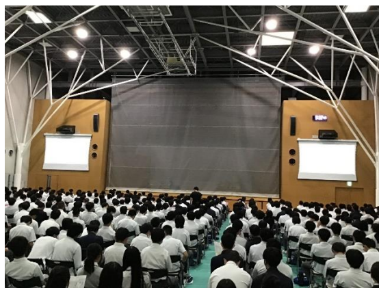
7/16(火) デートDVについての講話