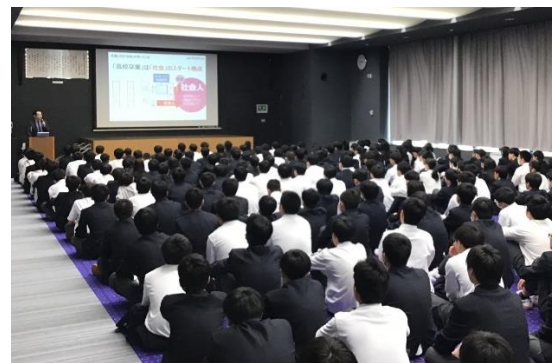
4月19日(金)～ 進路講話実施 進路と学習の深い関係を学びました。